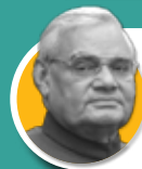
അടൽ ബിഹാരി വാജ്പേയ്

1998 മേയ് 16- ജൂൺ 1 1998 മാർച്ച് 19-1999 ഏപ്രിൽ 29 1999 ഒക്ടോബർ 3-2004 മെയ് 10