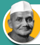
ലാൽ ബഹാദൂർ ശാസ്ത്രി

1964 മെയ് 27 - ജൂൺ 9 1966 ജനുവരി 11 - ജനുവരി 24