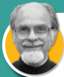
ഇന്ദർ കുമാർ ഗുജ്റാൾ