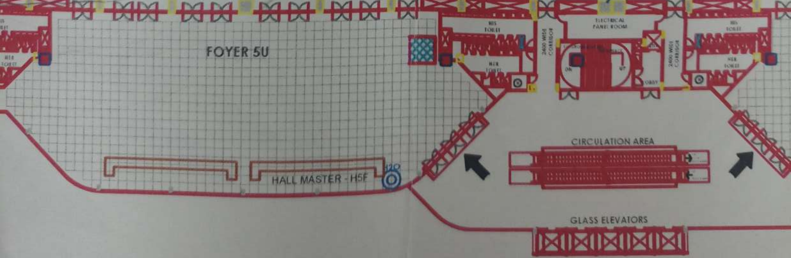
EXHIBITION HALL - 5 FIRST FLOOR